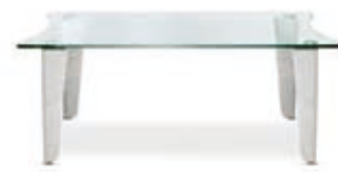
Tisch Status 75×120 Status coffee table 75×120