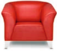
Sessel Status Status armchair