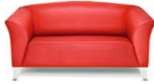
Zweier-Sofa Status Status 2-seater sofa