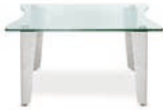
Tisch Status 90×90 Status coffee table 90×90