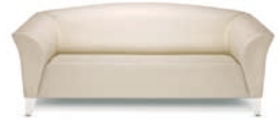
Dreier-Sofa Status Status 3-seater sofa